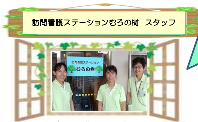
訪問看護ステーションむろの樹 スタッフ