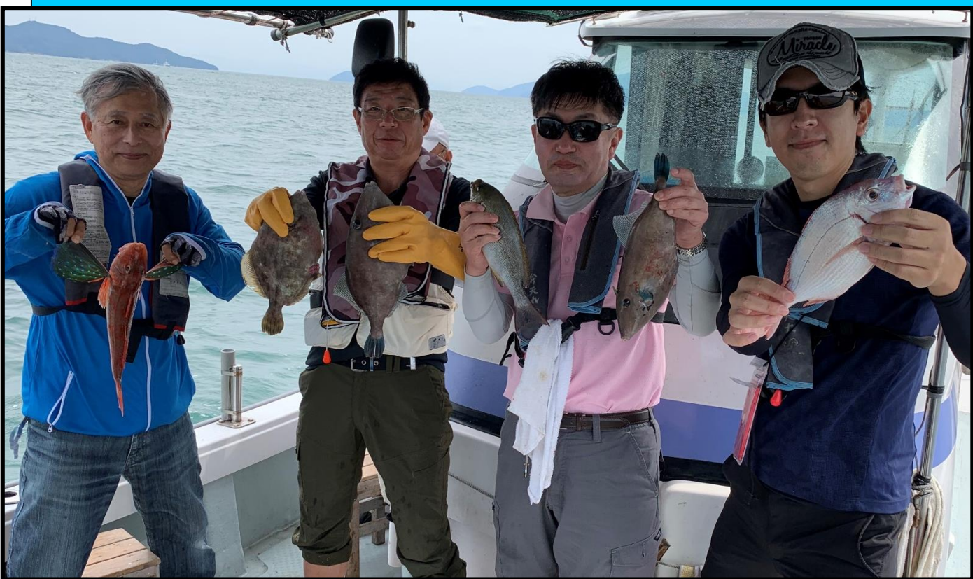
釣りし隊：平郡島沖にて