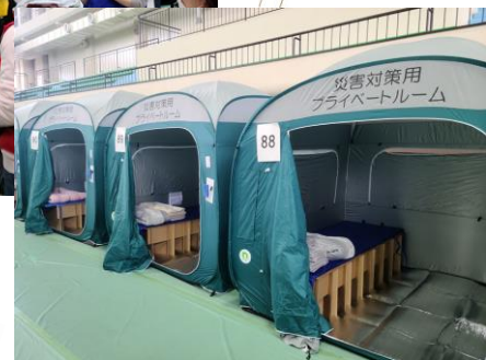
プライベートルーム