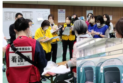
ミーティング風景

小松総合体育避難所は、職員数や物資も充足しておりライフラインも整っていたので、比較的避難所としては恵まれていたものの、段ボールベッドでの寝心地の悪さや隙間風が吹くなどの問題点を考えると決して良い環境ではなく、避難者さんからも不満の声も聞かれた。ここに至る過程や被災された現状を考えると胸が痛み、避難者の方に寄り添うことの難しさを感じた。