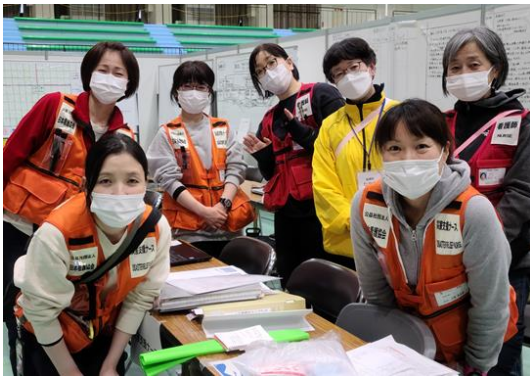
広島県災害支援ナースと共に

活動内容は、発熱や消化器症状のある方に対し健康観察や支援を行うことでした。派遣時の入所者15名のうち6名（インフルエンザ1名、コロナ陽性3名、コロナ濃厚接触2名）について看護師が支援しましたが、皆さん軽症で状態も安定しておりADLも自立していました。実際の活動は、環境整備、対象者の経過観察・記録、内服介助やトイレ誘導、必要に応じて医師の診察介助も行いました。