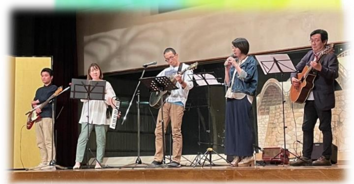
音楽サークル「メゾフォルテ」による演奏🎵