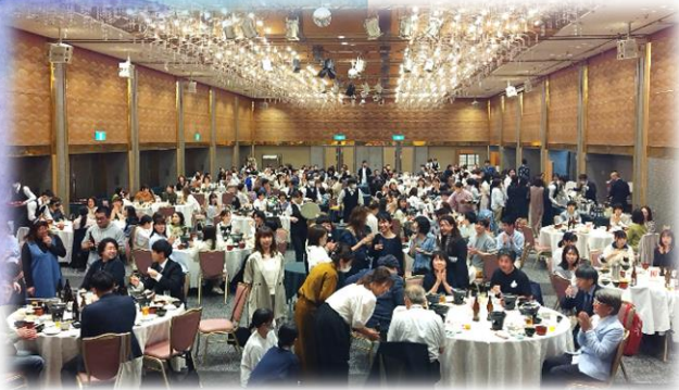
大人数が参加し盛り上がりました!!

コロナの影響で中止になっていた新入職員歓迎会ですが、4年ぶりに開催しました。今年度は15名の方が入職され、一人ずつ舞台上で自己紹介をして頂きました。仕事への意気込みや、自分の趣味の話など、個性溢れる内容でした。その他にも、サークル紹介や演奏会もあり、皆ワイワイガヤガヤ、美味しい食事を食べながら楽しめました。