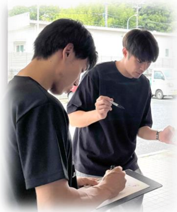
即席サイン会の様子