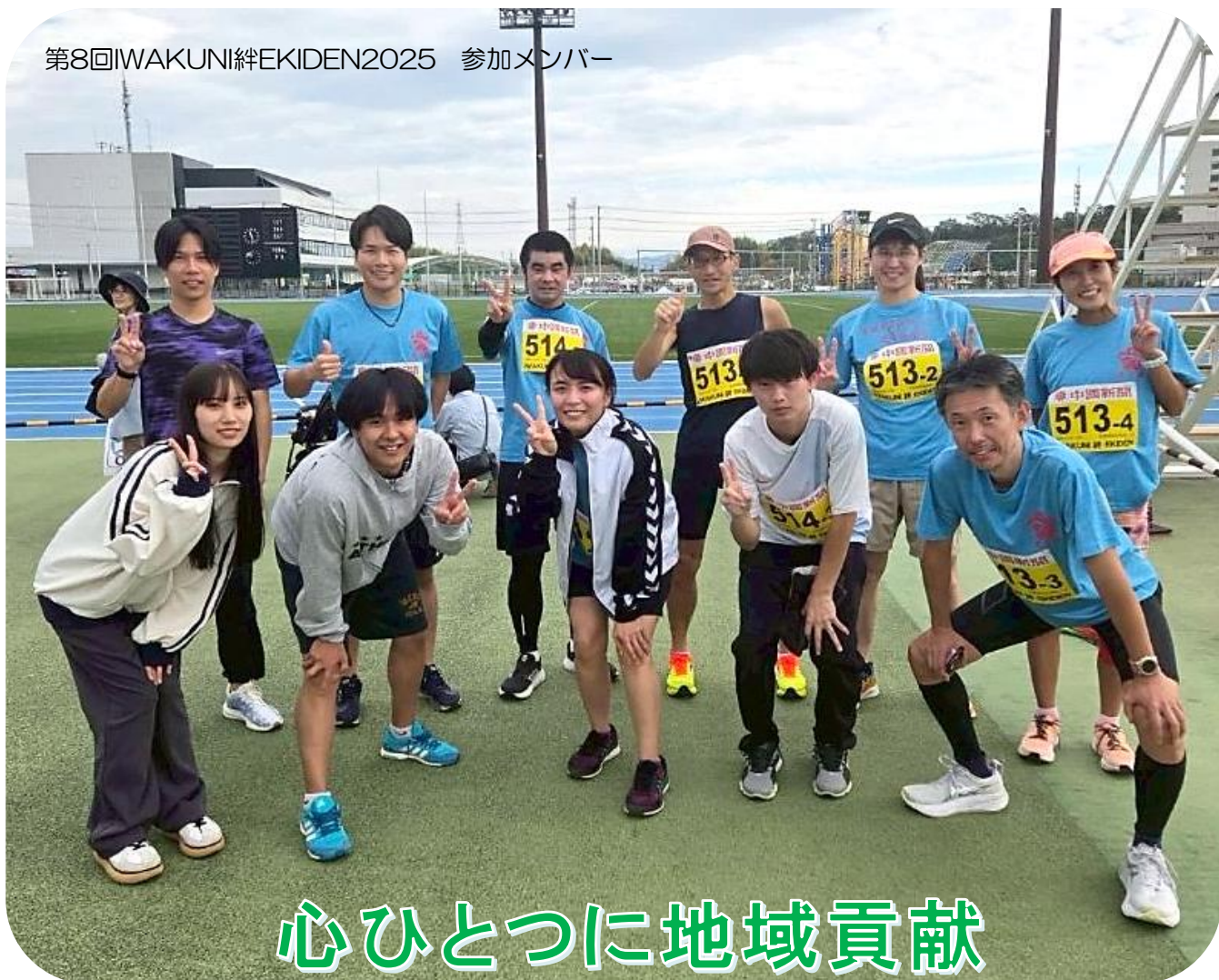
第8回IWAKUNI絆EKIDEN2025 参加メンバー